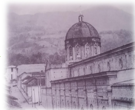
Vista de la microcuenca Las Cruces desde el casco urbano. Foto tomada en 1940

Paisaje socioecológico de la microcuenca Las Cruces: un territorio en constante transformación hacia su resiliencia