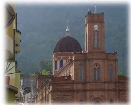
Vista de la microcuenca Las Cruces desde el casco urbano. Foto tomada en 2017